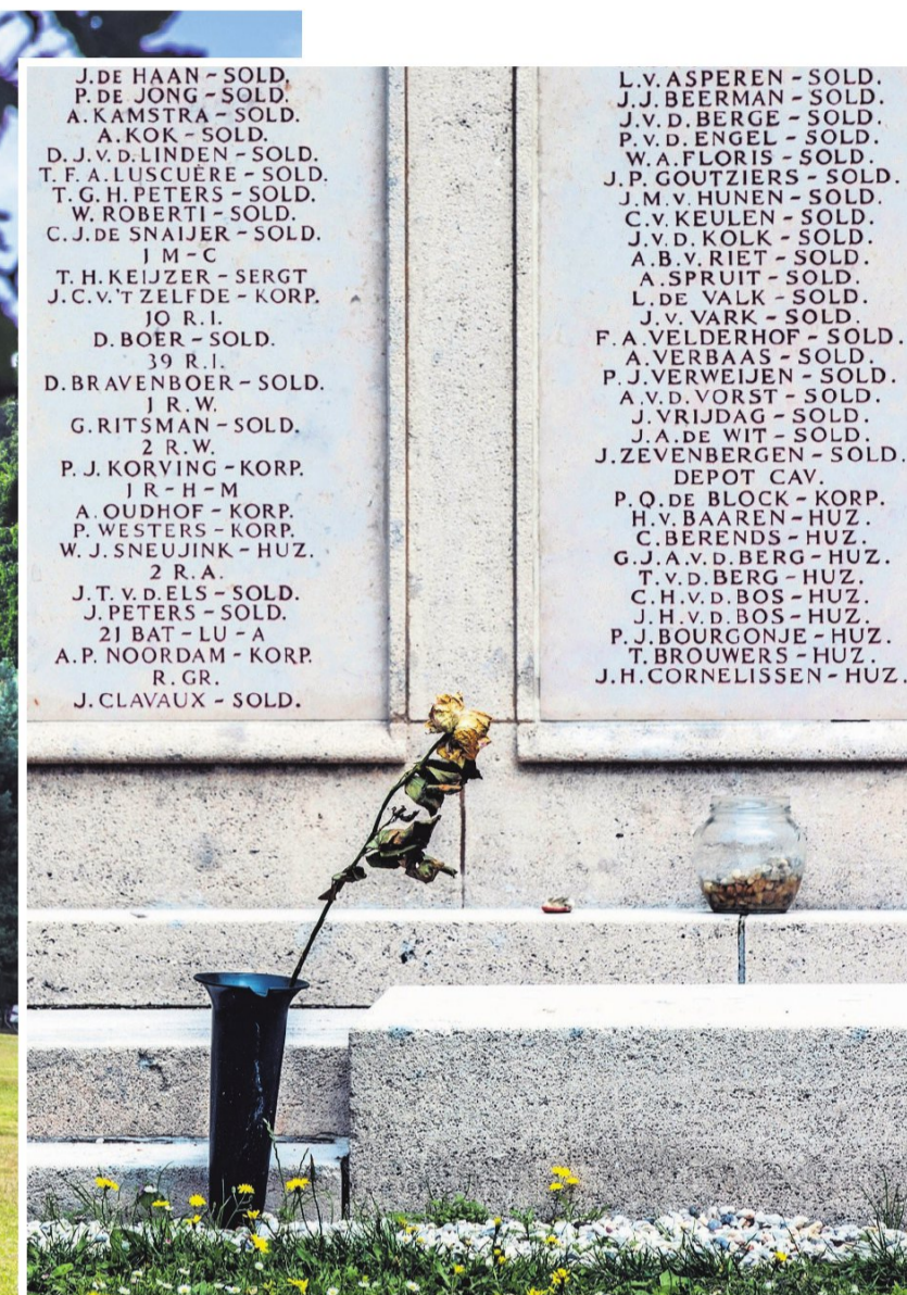
▲ In een massagraf op de algemene begraafplaats aan de Kerkhoflaan staat een troosteloos monument met namen van de gevallen.